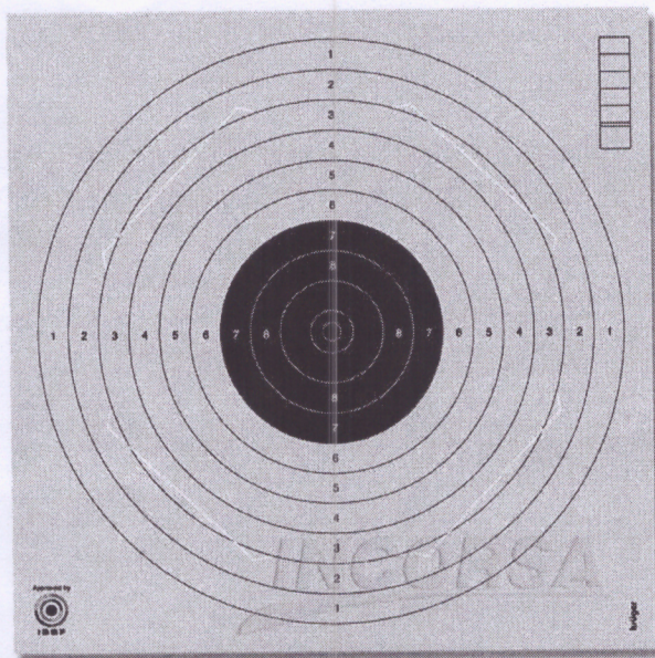
Tarcza nr 1

Miejski Klub Strzelecki Ligi Obrony Kraju w Raciborzu 47-411 Rudnik, ul. Nowa 46 tel. 606 764 837