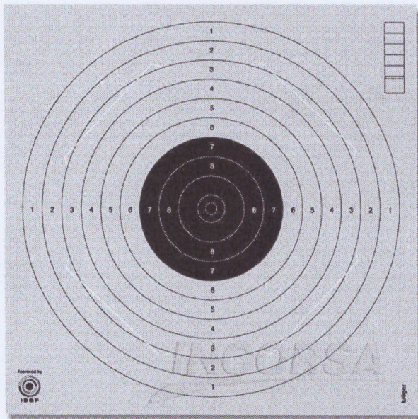
Tarcza nr 1

Miejski Klub Strzelecki Ligi Obrony Kraju w Raciborzu Plac Bonaterów Westerplatte 2/1a 47-400 Racibórz