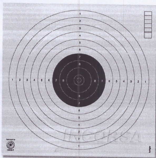
Tarcza nr 1